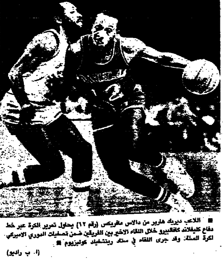
اللاعب ديريك هارين من دالاس مفرسكس (رقم 12) يحاول تمرير الكرة عبر خط دفاع كليفلاند كافالييرز خلال المباراة الاخيرة بين الفريقين ضمن تصفيات الدوري الأمريكي لكرة السلة...